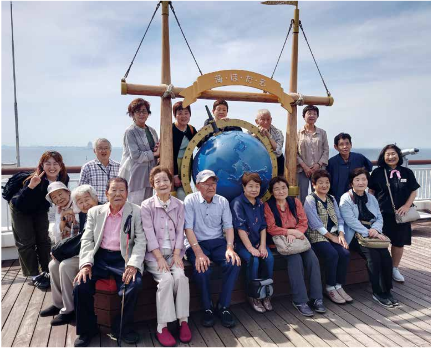
6月1日から2日にかけて、老人クラブの旅行で房総半島を訪れました。海ほたるパーキングエリアでは、東京湾をバックに記念撮影。晴天に恵まれ、楽しい2日間となりました。