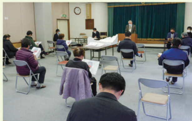
▲ 中央公民館での説明