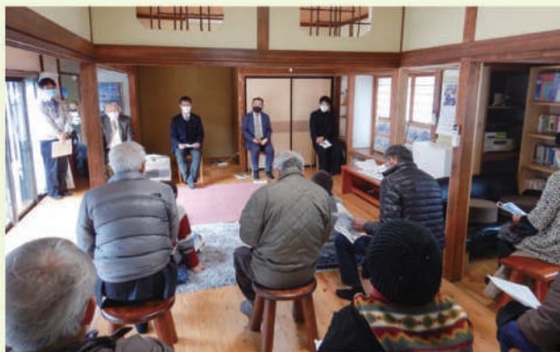
▲ コミュニティサロンでの説明