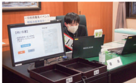
▲ 模擬決裁もしました。