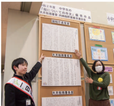
▲ 税務署内に作文が掲示されました。